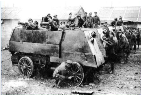
Membres du 1 st Canadian Motor Machine Gun Brigade perpétué par le RCH Members of the 1 st Canadian Motor Machine Gun Brigade perpetuated by the RCH