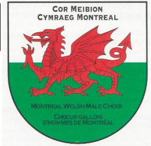
Cimier du Chœur Gallois des Hommes de Montreal Crest of the Montreal Welsh Male Choir

Le chœur gallois des hommes de Montréal suit une tradition forte qui a été répandue en Amérique du Nord par des immigrants venant du pays de Galles. Ces chœurs d'hommes, qui sont présents dans les principales villes du Canada, se jouissent de chanter lors des évènements sportifs et civiques. Ils sont des chanteurs très habiles qui aiment chanter des harmonies et produire de la belle musique.