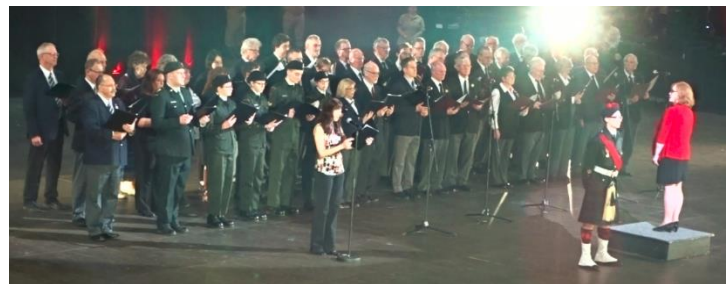
Groupes combinés lors de la représentation - Combined choir during the performance

Mission réussie et merci à tous les participants.