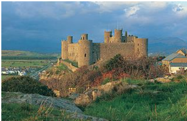
Le Château Harlech au pays du Galle Harlech Castle in Wales

Men of Harlech is an old Welsh Hymn that was originally written to commemorate the defenders of Harlech Castle in Wales during a 7-year siege during the War of the Roses that lasted from 1461 to 1468. Since that time it has been adopted by numerous military units, including the Royal Canadian Hussars as their Regimental march. A Regimental march is an important tradition used by the military to reinforce the resolve of soldiers, especially when they are involved in difficult situations.