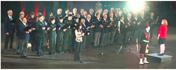
Groupe combiné lors de la représentation - Combined choir during the performance