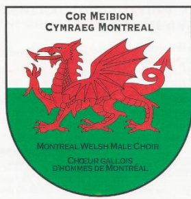
Cimier du Chœur Gallois des Hommes de Montreal Crest of the Montreal Welsh Male Choir

The Montreal Welsh Male Choir carries on a strong choral tradition that was brought to North America by Welsh immigrants. Welsh Male choirs, which are present in most major cities across Canada, take great pleasure in singing at major sports and other civic events. They are very accomplished singers who take delight in harmonising and making beautiful music.