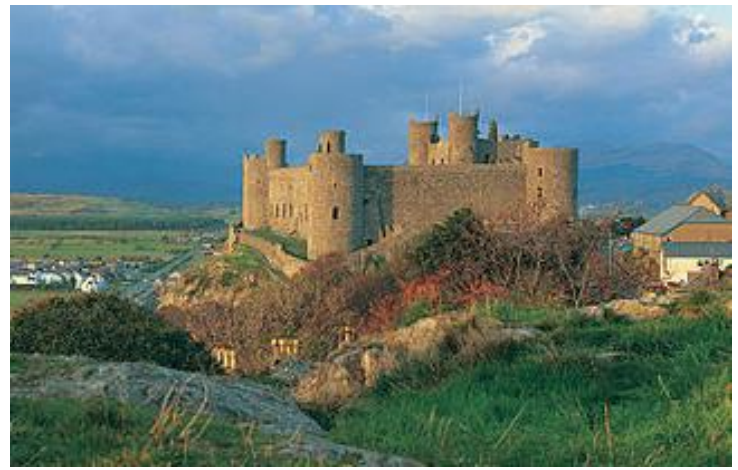
Le Château Harlech au pays du Galle Harlech Castle in Wales

Men of Harlech, un vieil hymne du pays de Galles, a été conçu originalement pour faire hommage aux soldats qui ont défendu le Château Harlech au pays de Galles pendant un siège de bataille de sept ans lors de la Guerre des Roses entre 1461 et 1468. Depuis ce temps, l'hymne a été adopté par plusieurs unités militaires, incluant le RCH, et tant que marche régimentaire. Une marche régimentaire est une tradition importante utilisée par les forces armées pour renforcer la détermination des soldats, notamment lorsqu'ils sont dans des circonstances difficiles.