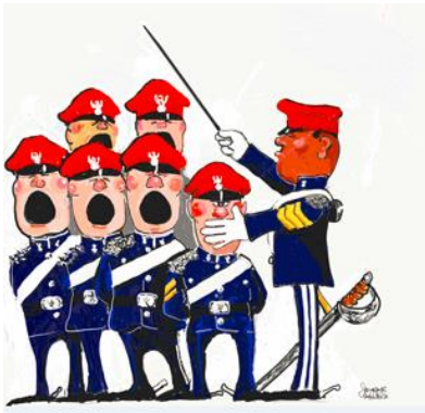
Cartoon désigné le LCol. Roman Jarymowycz Cartoon by the late LCol. Roman Jarymowycz

Mission accomplished and much thanks to the participants.