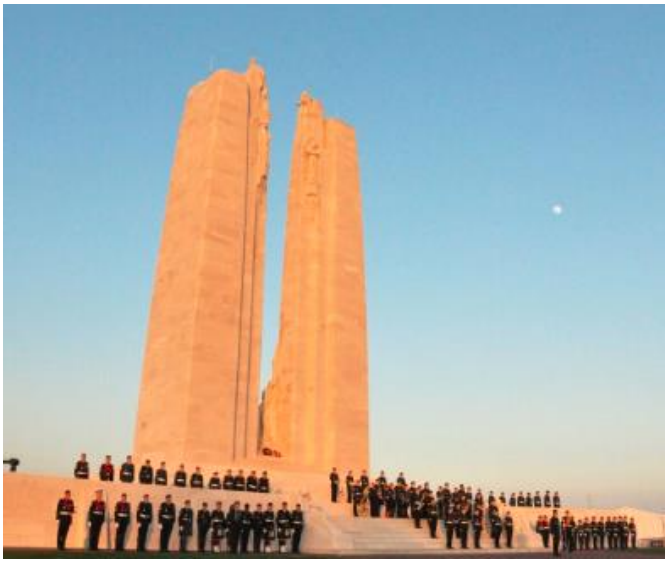
Honour Guard in front of the Vimy Memorial