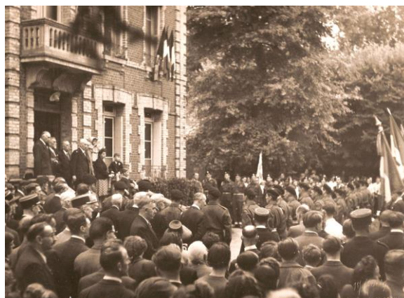
Accueil des canadiens devant la mairie

municipalité a décidé d'élever une stèle à leur mémoire. Cette manifestation est un des gages de reconnaissance de la France pour le Canada.