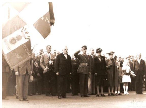
Au monument, Route de Rouen