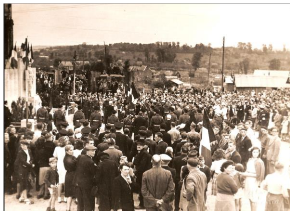
Le cortège arrivant Place Notre Dame

profondément unis : unis dans la haine de l'ennemi en fuite, unis dans l'amour de nos libérateurs, unis dans la joie de la liberté. Ce même esprit d'union et de concorde s'est retrouvé dimanche dernier pour fêter le 2 e anniversaire de cette libération et, comme au 1 er septembre 44, les maisons étaient pavées de drapeaux et les habitants se pressaient dans les rues.