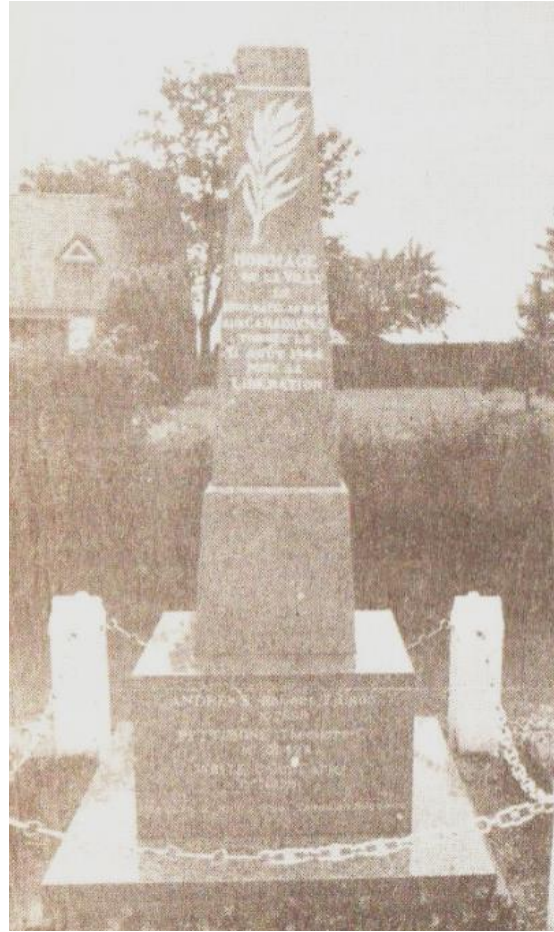
La stèle érigée Route de Rouen a été rehaussée. Le socle porte enfin, en lettres d'or, 44 ans après, les noms des trois soldats canadiens.