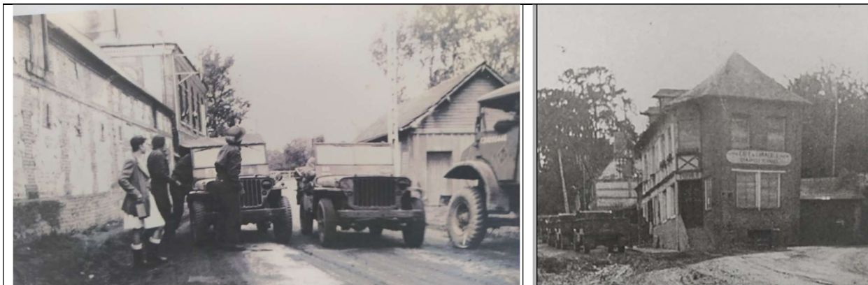
Véhicules logistiques ou administratifs, potentiellement du 7 è Recce à Bures-en-Bray

Le commandant, voyant la situation, a remplacé la 1 è troupe par une troupe de l'escadron « B », puis la 1 è troupe s'est retirée pour prendre un repas et passer une bonne nuit de repos.