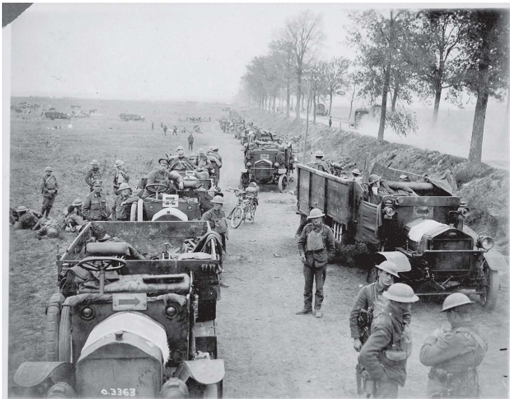
Figure 20.5. Brigade de mitrailleuses motorisées canadienne attendant le long de la route Arras-Canbrai, août 1918 ; cette image montre les batteries de mitrailleuses motorisées qui, comme la batterie Borden, n'utilisaient pas de véhicules blindés mais transportaient hommes, armes et fournitures sur des camions. La batterie Borden aurait pu ressembler à ceci lorsqu'elle est entrée en action en mars 1918.