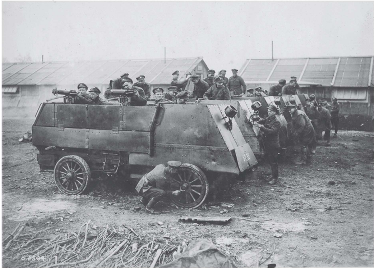
Figure 20.2. Batteries de mitrailleuses blindées Brutinel originales, qui sont devenues les Batteries A et B de la 1re Brigade canadienne de mitrailleuses motorisées en 1916.

Quelques jours après son arrivée au front, Joliat était déjà engagé dans des combats sérieux. Le 6 avril 1916, les Allemands dirigèrent un lourd tir d'artillerie sur une section des tranchées canadiennes dans le saillant d'Ypres pour couvrir une tentative d'occupation de plusieurs cratères d'obus. La batterie Borden a installé une mitrailleuse pour diriger le feu sur les Allemands en avance, mais elle a été mise hors d'usage pendant un certain temps par un barrage d'artillerie concerté. Une deuxième mitrailleuse fut alors rapidement mise en position et les deux pièces dirigèrent un feu intense sur l'ennemi, ce qui permit au 29 e bataillon canadien de se retirer de sa position exposée sans pertes graves. Le journal de guerre de la batterie Borden a enregistré les remerciements de l'officier commandant le 29 e bataillon et a noté que plusieurs membres de la batterie, y compris Joliat, « ont été très favorablement mentionnés » 12 .