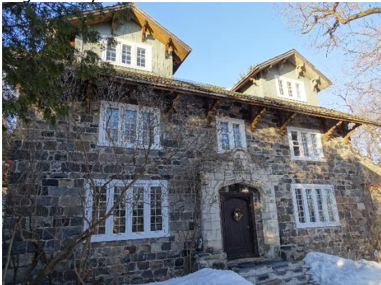
Front view of the Guérin residence in Mont-Saint-Hilaire