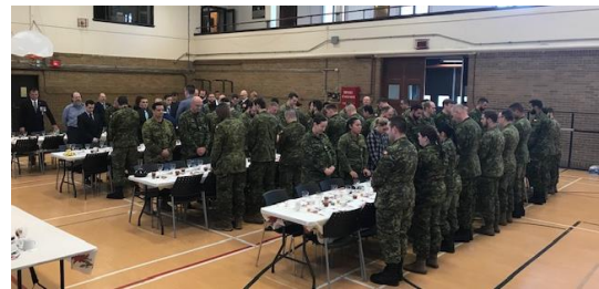
A prayer before the meal