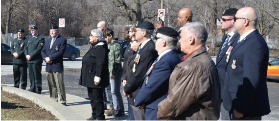
Twenty members of the Association and eight members of the regiment were on hand to support the event.

to the north with only a short delay. Lt. Harris and his troops did not stay long in Wergea, but their passage had a very significant impact on its population, as it marked the liberation after 5 years of miserable occupation. More information about this liberation can be found on the history pages of the RCH Association website. https://rch.ca/en/rch-history/ww2-liberation-stories/